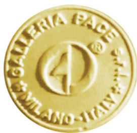
Sigillo Galleria Pace